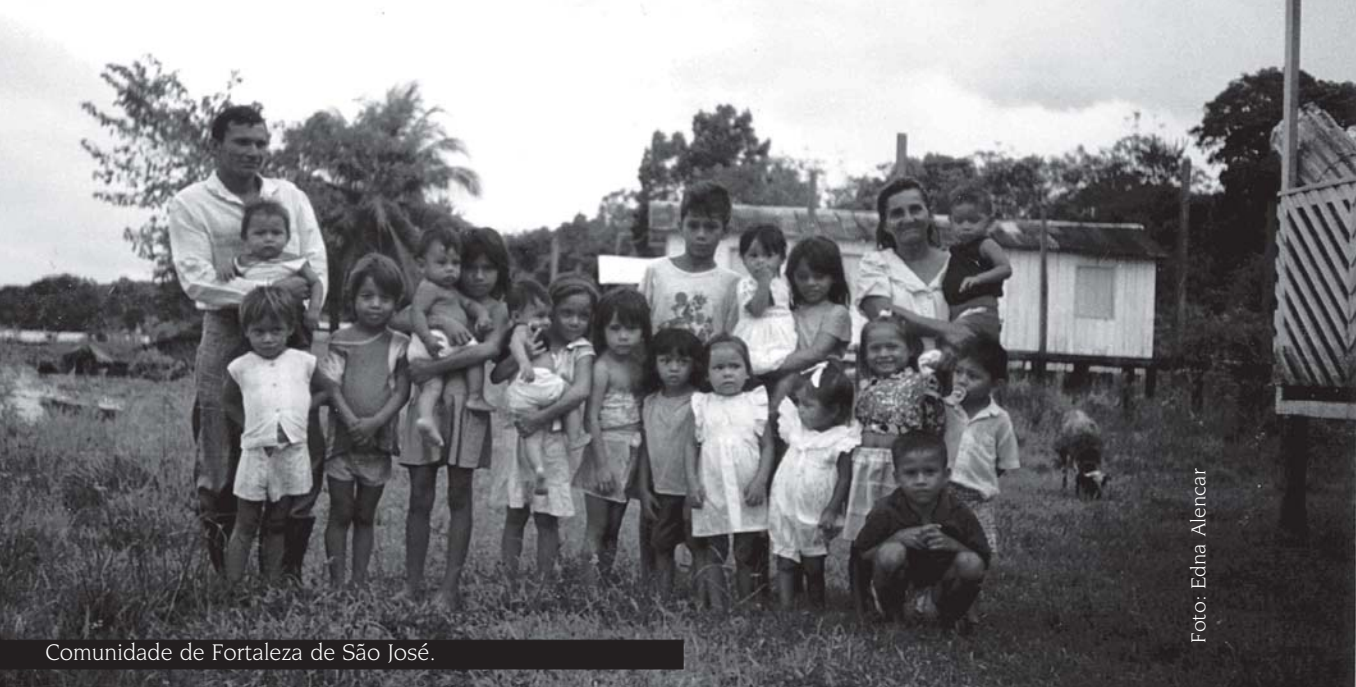
Comunidade de Fortaleza de São José.