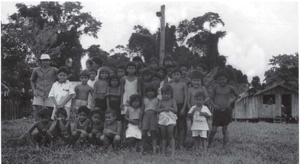
Moradores da comunidade de Porto Braga.