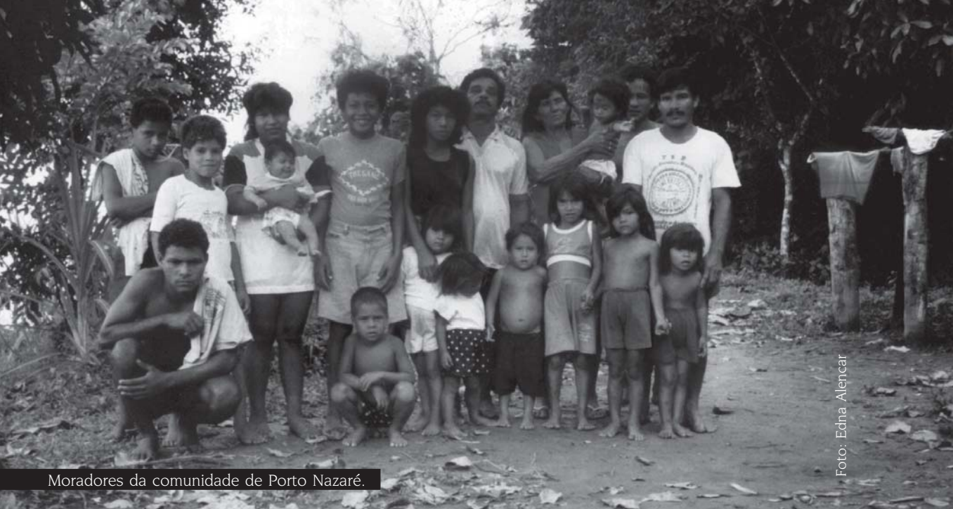
Moradores da comunidade de Porto Nazaré.