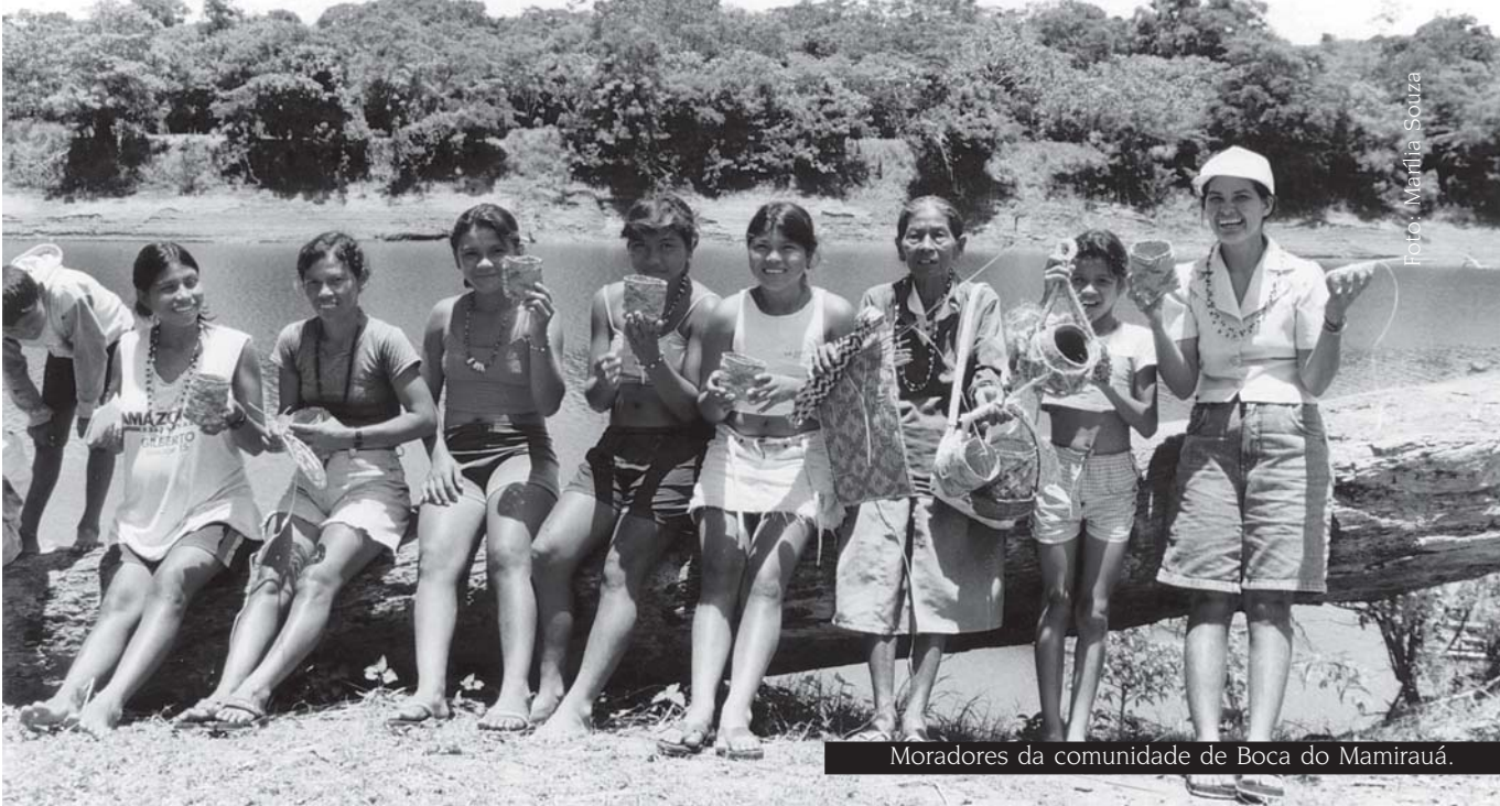
Moradores da comunidade de Boca do Mamirauá.