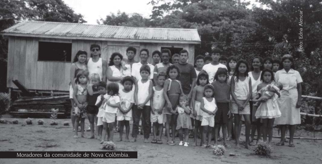
Moradores da comunidade de Nova Colômbia.