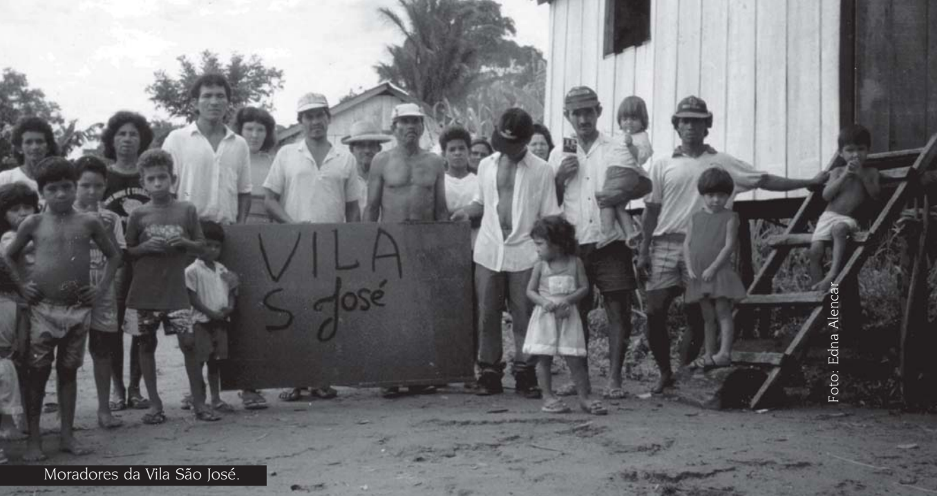
Moradores da Vila São José.