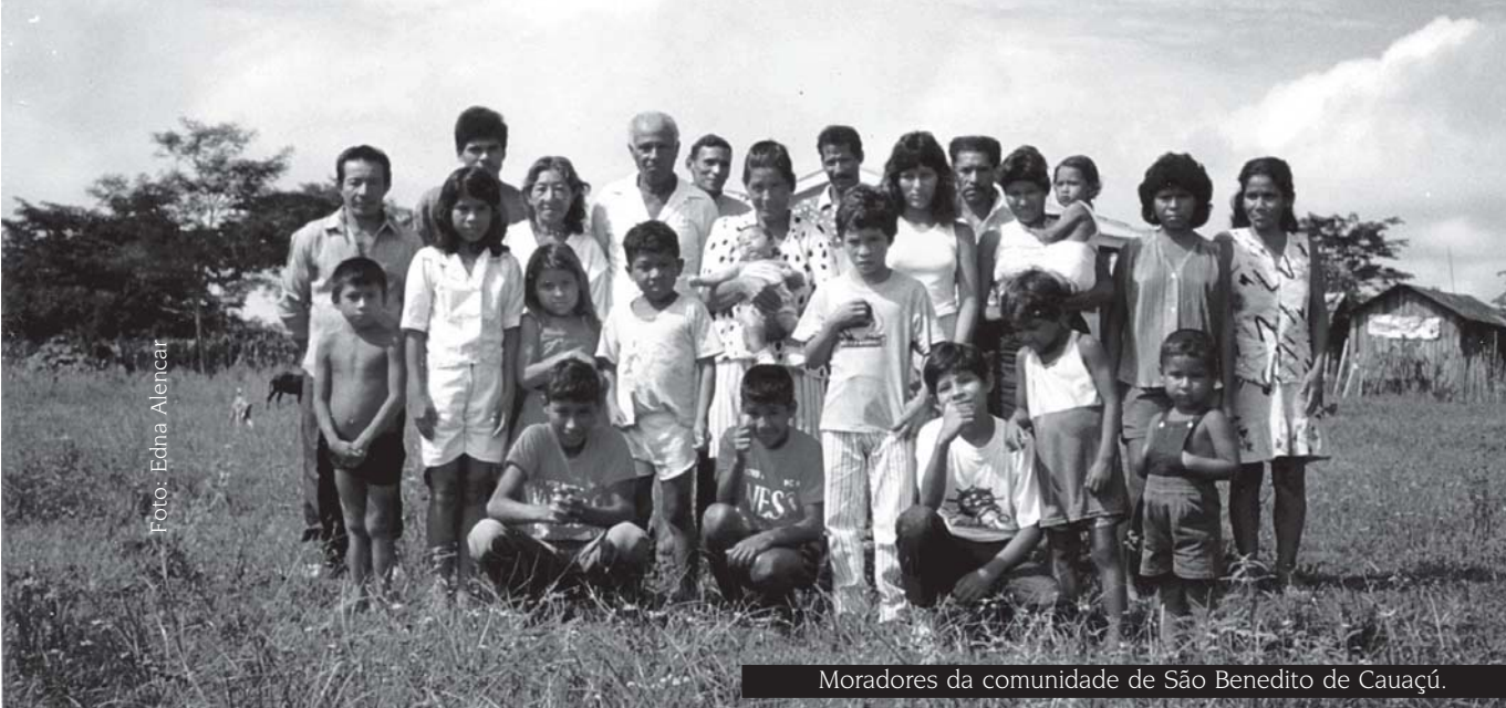
Moradores da comunidade de São Benedito de Cauaçu.