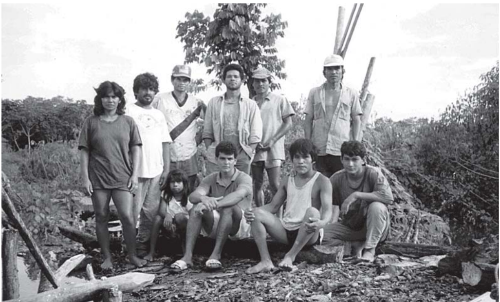
Moradores da comunidade de São Francisco do Mirafior.