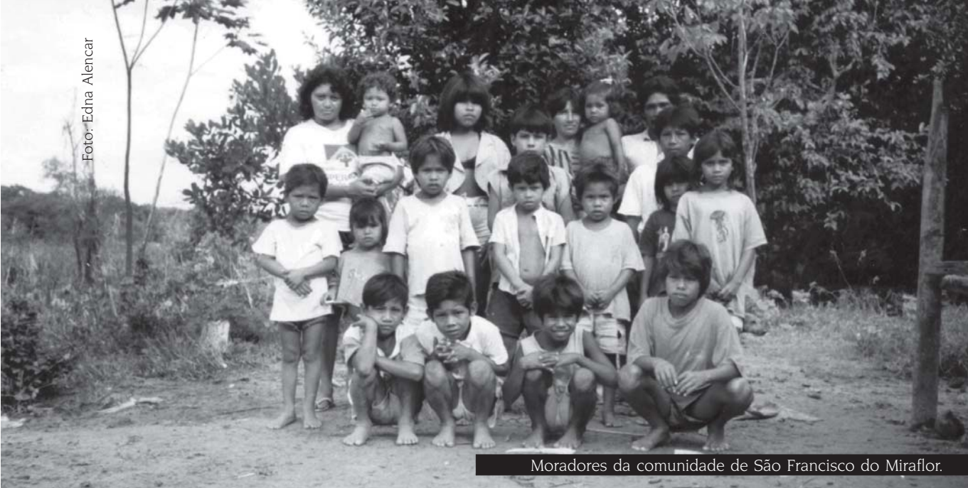
Moradores da comunidade de São Francisco do Mirafior.