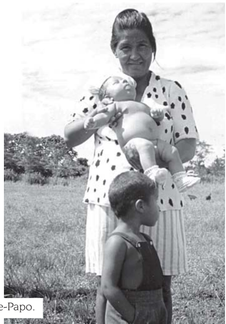
Moradora da comunidade de Bate-Papo.