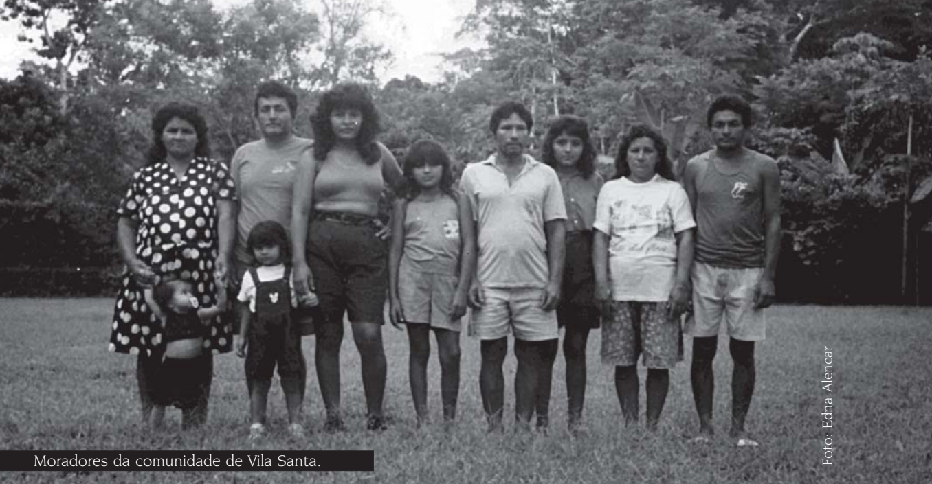
Moradores da comunidade de Vila Santa.