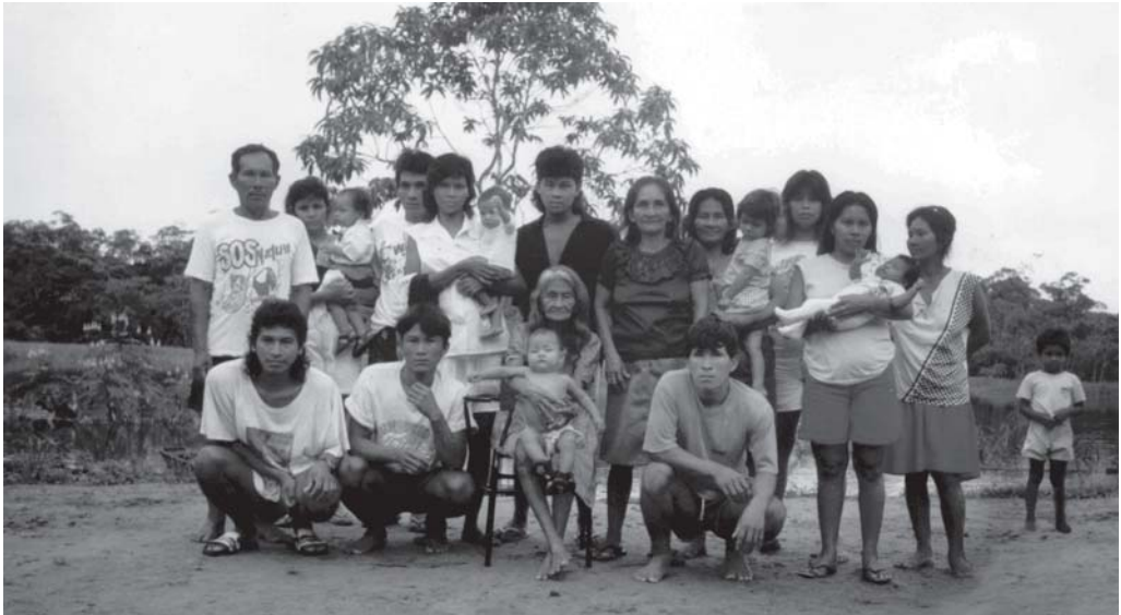
Moradores da comunidade do Aiucá.