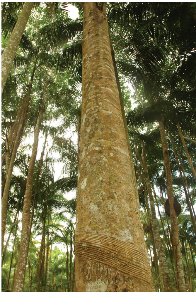
Seringueira no açaizal, exemplo da paisagem como memória do tempo de exploração da borracha.