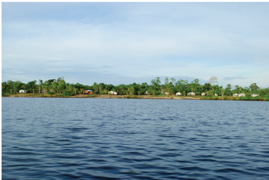
Vista geral da comunidade Boa Esperança durante período de vazante do lago.