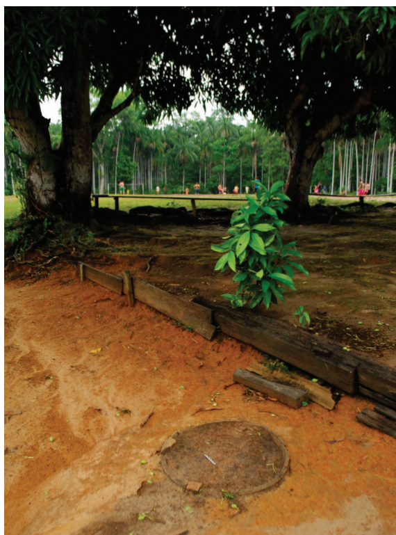
Exemplo de urna exposta devido à erosão na comunidade Boa Esperança. Ao fundo, campo de futebol e açaizal.

Grande parte dos moradores se reconhece e enfatiza a descendência nordestina, autodenominando-se arigós , e são assim classificados por moradores de outras comunidades vizinhas 7 . A categoria social arigó é bastante específica no contexto de classifica-