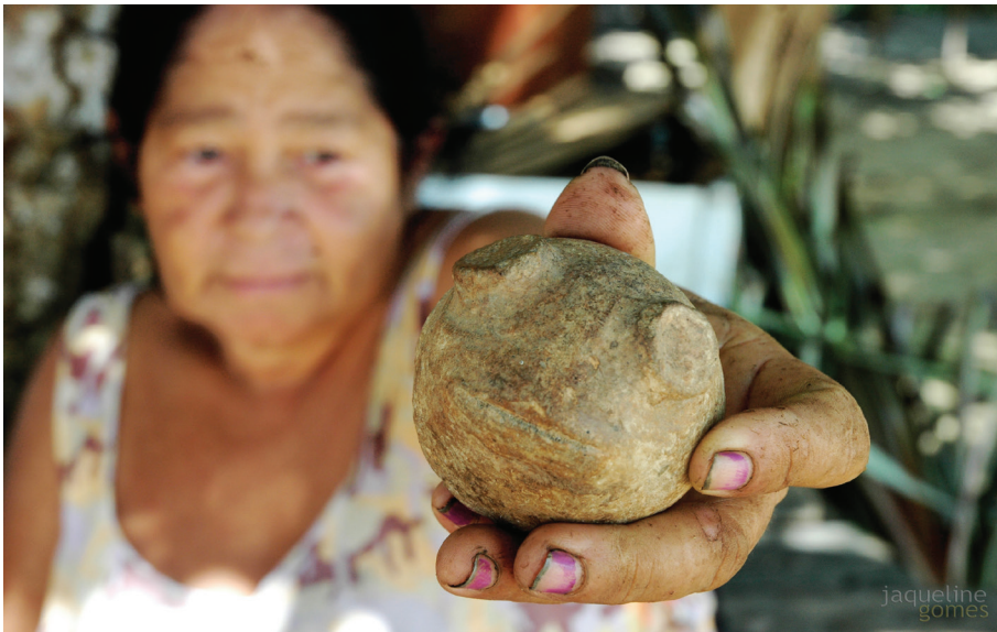
Moradora mostra peça arqueológica, parte da coleção particular que mantém em sua casa.