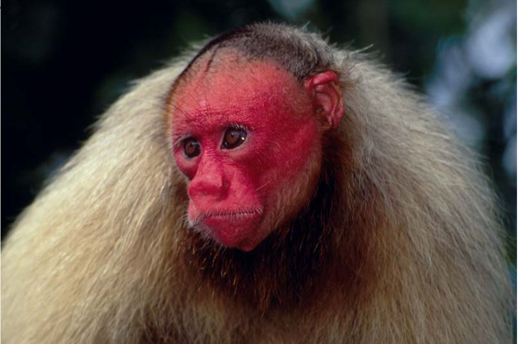
O macaco Uacari-branco (Cacajao calvus calvus), primata brasileiro ameaçado de extinção

O grupo de pesquisadores que se dedicava ao problema percebeu, conseqüentemente, que sem a participação da população local, tanto no manejo dos recursos, como na gestão da área, aquela unidade de conservação não seria viável no longo prazo (Lima-Ayres, 1994). Por todos esses motivos, segundo a proposta da época, as populações continuariam a ter direito de residir na área e a utilizar os recursos naturais locais, desde que cumprissem com as normas do plano de manejo e acatassem o sistema de zoneamento a ser elaborado para a unidade. Além desse importante aspecto, havia ainda outra característica igualmente fundamental: a abordagem da gestão e manejo da reserva de desenvolvimento sustentável teria como base uma combinação do conhecimento científico com o tradicional. Um intenso programa de pesquisas foi implantado tanto para servir subsídios localmente para a regulamentação das normas do plano de manejo, quanto também como base para influenciar políticas públicas em níveis regional e nacional. As principais características do modelo de RDS, que se criava naquele período, eram o manejo participativo aliado à pesquisa científica que o subsidia.