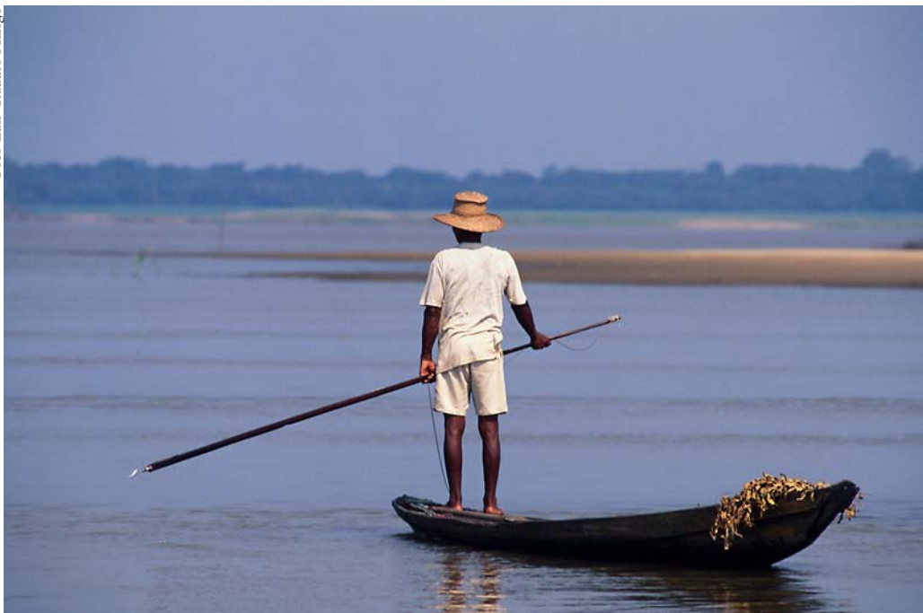
Pescaria de pirarucu na reserva de desenvolvimento sustentável Mamirauá

pode ser considerada um formidável avanço àquela do início desta pesca, quando mais de 70% dos animais abatidos eram ilegais (Queiroz e Sardinha, 1999). Hoje os estoques deste recurso, mesmo em áreas de manejo sustentado intenso, ainda apresentam crescimento, que é anualmente documentado (IDSMS, 2005).