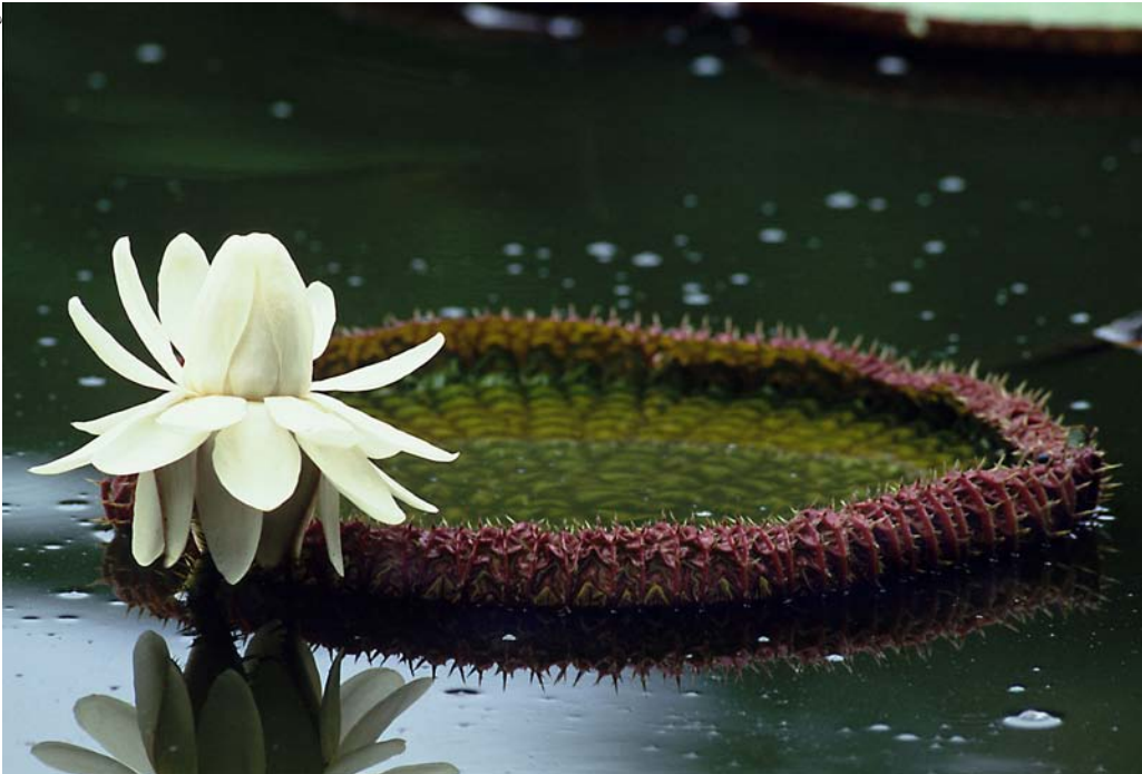
A vitória-régia (Victoria amazonica) é uma planta aquática típica da região amazônica