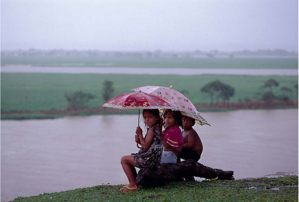
Crianças observam a dinâmica das águas dos rios da região causada pela chuva